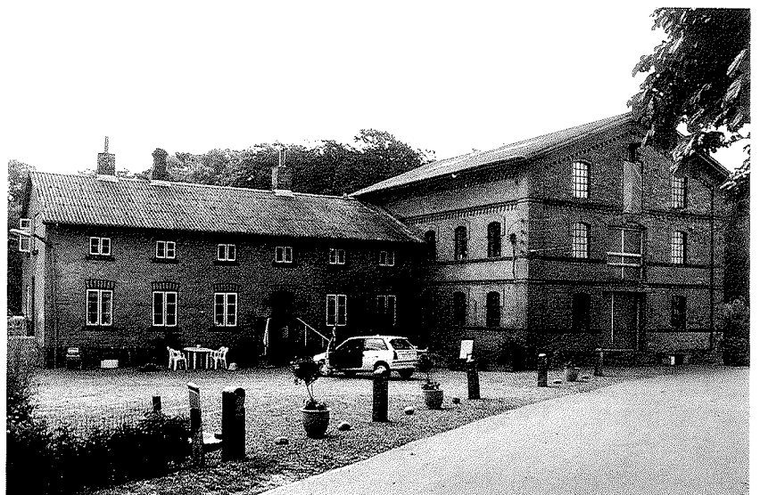
Torning Mølle er et meget tidstypisk industrianlæg fra slutningen af forrige århundrede - opført i gule sten med røde dekorative elementer, trempelkonstruktion og forholdsvis flad taghældning. Anlægget er meget helstøbt og uden væsentlige ændringer.

Kær Mølle er smukt beliggende, men kun møllegården og dens hovedbygning er tilbage og i rimelig intakt stand. Som mange andre af landets vandmøller er også de tre nævnte møller placeret markant i landskabet.