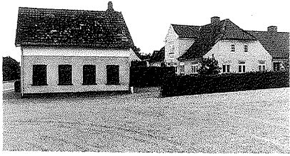
Dette håndværkerhus i midten af Hejls Kirkeby er formentlig fra midten af forrige århundrede for så vidt angår stuehuset, mens den høje, fritliggende værkstedsbygning er senere.