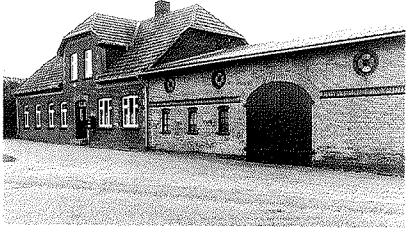
Købmandsbutikken i Store Anslet var i drift indtil sommeren 1992 - gennem de sidste 54 år med samme indehaver. Bygningerne er typiske eksempler på, hvorledes der omkring århundredskiftet byggedes til dette formål. Huset til venstre, der rummede bolig, har lidt mere "stil" end den trempelbyggede lagerbygning.