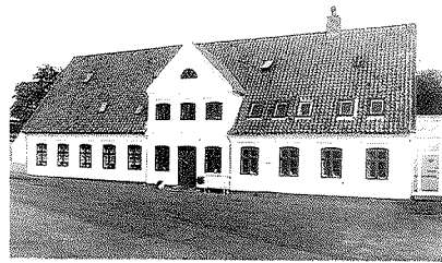
Aller Mølles hovedbygning er i sit ydre et smukt eksempel på byggeriet fra slutningen af 1700-tallet. Bygningen har et umiskendeligt landligt rokokopræg. Desværre er det indre noget ændret. De ældste vandmøllebygninger er stort set væk, men erstattet af disse ganske flotte, hvidkalkede bygninger. En række senere bygninger og siloer er heldigvis adskilt fra de gamle bygninger.