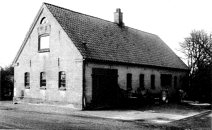
Smedeværkstedet i Åstorp er fra 1927, bygget i det meget moderne materiale der hed cementsten. Bygningen har stort set ikke undergået ændringer siden opførelsen.

Udover de her nævnte findes enkelte gode småhuse i landdistrikterne, huse der delvis har været beboet af folk, der har været beskæftiget indenfor håndværkerhverv.